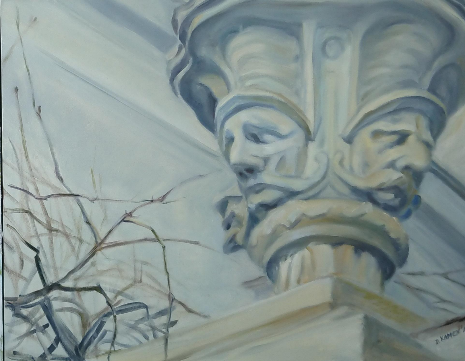
Gesichter, Öl auf Leinwand, Acryl auf Faserplatte, 2018 / Faces, oil on canvas and acryl on fibreboard, 2018