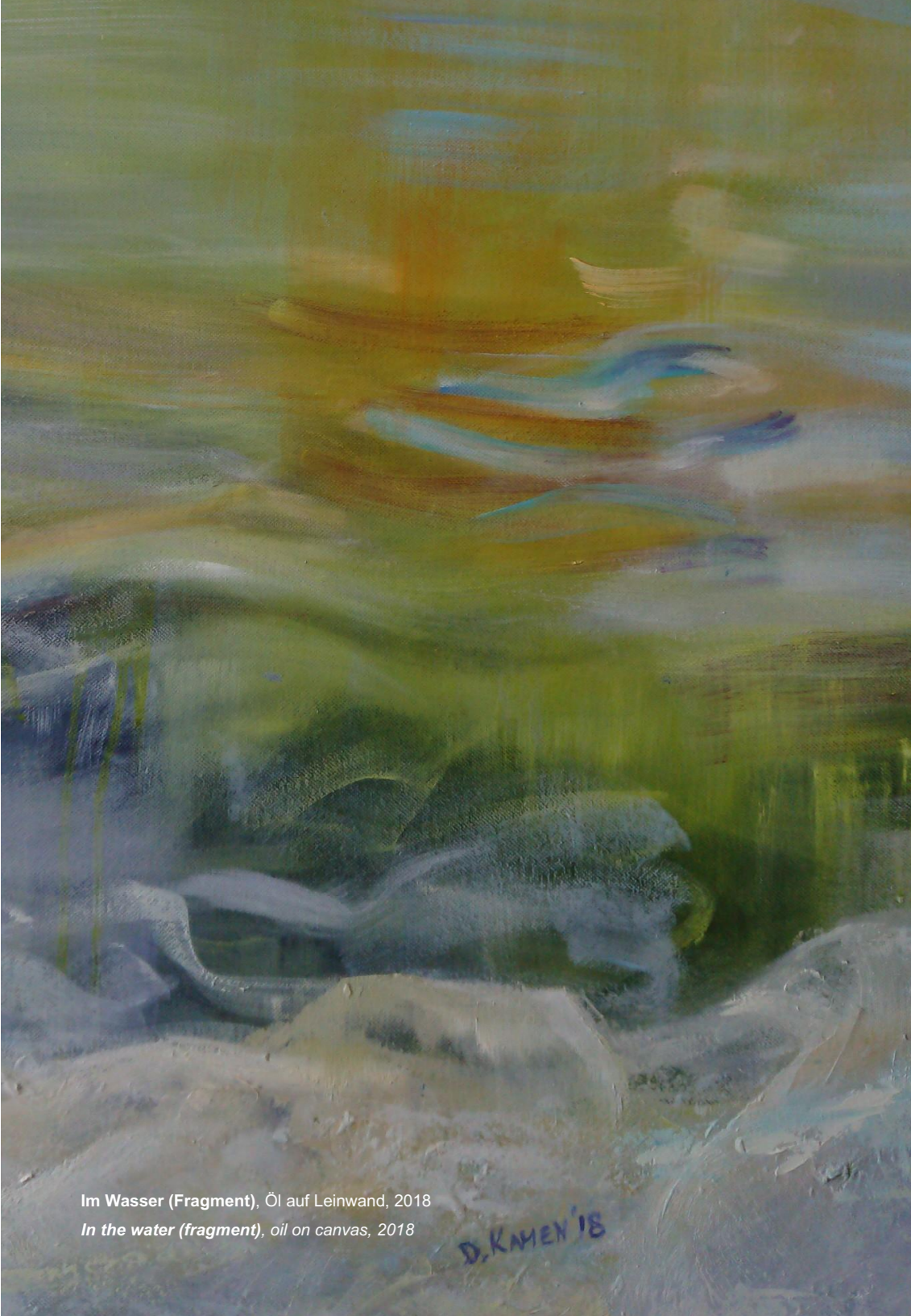
Im Wasser (Fragment), Öl auf Leinwand, 2018 In the water (fragment), oil on canvas, 2018